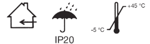
ABB s.r.o. Elektro-Praga