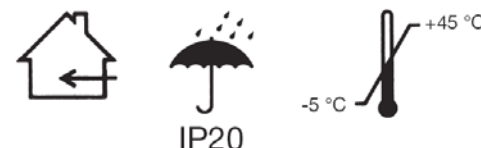
ABB s.r.o. Elektro-Praga

Resslova 3 CZ-466 02 Jablonec nad Nisou tel.: 483 364 111 fax: 483 364 159 e-mail: epj.jablonec@cz.abb.com http://www.abb-epj.cz