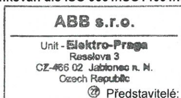
ABB s.r.o. Management System je certifikován dle ISO 9001/ISO14001/ISO18001.

Toto prohlášení bylo vystaveno na základě dostupných informací od dodavatelů ke dni vystavení prohlášení.